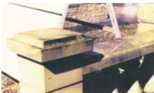
Sans traitement Mat Prévention