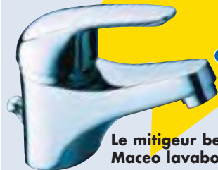
Le mitigeur bec fixe Maceo lavabo.