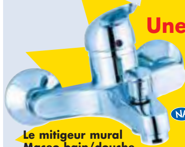
Le mitigeur mural Maceo bain/douche.